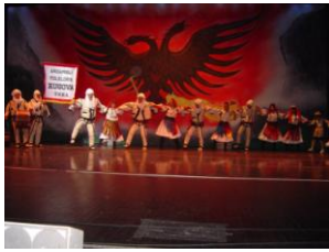
Vallja e Rugovës

11. Numëro pesë valle popullore që dikush nga ju edhe mund t'i vallëzojë bukur ndoshta ?