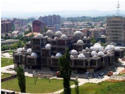
Biblioteka Kombëtare e Kosovës

38. Cilin institucion kulturor më shumë rëndësi paraqet kjo fotografi?