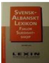
Fjalori suedisht- shqip

43. Kush e botoi fjalorin e parë suedisht shqip në Suedi?