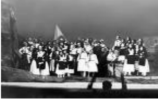
Opera e parë shqiptare "Mrika"