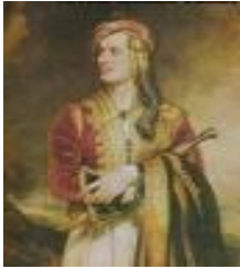
Bajroni me kostume shqiptare

39. Vallet tona popullore janë pëlqyer edhe nga të huajt. Cili shkrimtar botëror u bëri një përshkrim të bukur valleve tona?