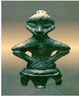
Mbretëresha dardane në fron.

36. Çka paraqet kjo figurë ilire e periudhës neolite që ruhet në Muzeun e Kosovës?