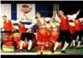
Një valle e Ansambli Kombëtar Shota.

37. Si quhet Ansambli Kombëtar i Këngëve e Valleve në Kosovë?