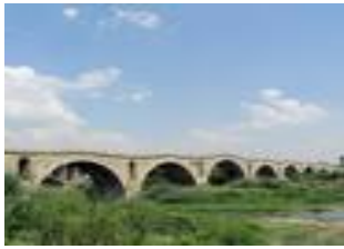
Ura e Terzive në afërsi të Gjakovës.

30. Si quhet kjo urë që shihni në ekran dhe ku ndodhet?