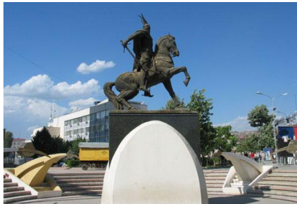
Përmendorja e Skënderbeut në Prishtinë

45. Kush është autor i përmendorës së Skënderbeut që ndodhet në qendër të Prishtinës?