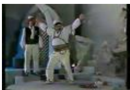
“Halili e Hajria- baleti i parë”