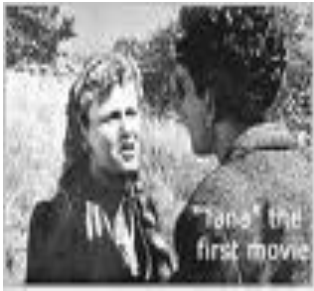
Filmi i parë "Tana"

Filmi i parë shqiptar i metrazhit të gjatë është filmi "Tana" i realizuar në vitin 1958 nga Kinostudio "Shqipëria e Re".