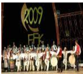
Festivali i Gjirokastrës 2009

Festivale muzikore me karakter gjithëkombëtar janë: Festivali folklorik i Gjirokastrës, Festivali i folklorit burimor në Drenas, Festivali i këngës në Radio televizion, Festivali i këngëve qytetare “Zambaku i Prizrenit”, Festivali i Ohrit, Festivali i Tetovës “Sharri këndon”, etj.