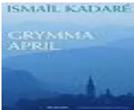
Ballina e romanit ”Prilli i thyer” në suedisht

Vepra e fundit e Ismail Kadaresë përkthyer në suedisht titullohet “Grymma april”. Vepra është përkthyer nga frëngjishtja në suedisht ndërsa romani në shqip titullohet “Prilli i thyer”. Edhe kjo vepër është botuar nga shtëpia botuese me famë në Suedi Albert Bonniers Förlag dhe vepra është mirëpritur e shoqëruar me kritika të shumta afirmative.