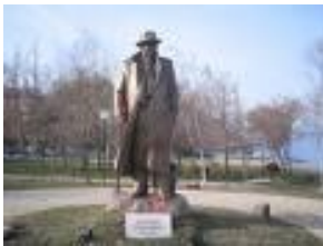
Shtatorja e Lasgush Poradecit