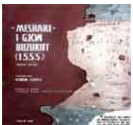
Meshari – libri më i vjetër shqip