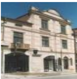
Ndërtesa ku u mbajt Kongresi i Manastirit

Kongresi i Alfabetit të gjuhës shqipe u mbajt më 14 - 22 nëntor 1908 në Manastir. Morën pjesë 150 delegatë nga qytete të ndryshme dhe nga klube e shoqëri patriotike brenda e jashtë vendit. Në mesin e delegatëve ishin edhe: Luigj Gurakuqi, Mithat Frashëri, Gjergj Fishta, Gjergj Qiriazi etj. Në këtë Kongres u vendos që shqipja jonë të përdorë alfabetin latin. Kryetar i Kongresit u zgjodh Gjergj Fishta kurse sekretare u zgjodh Parashqevi Qiriazi. Në Manastir filloi punën edhe shtypshkronja që pati rëndësi të veçantë për botimin e librave shkollor. Në këtë qytet u formua edhe Klubi i Manastirit që tuboi shumë intelektualë e patriotë shqiptarë.