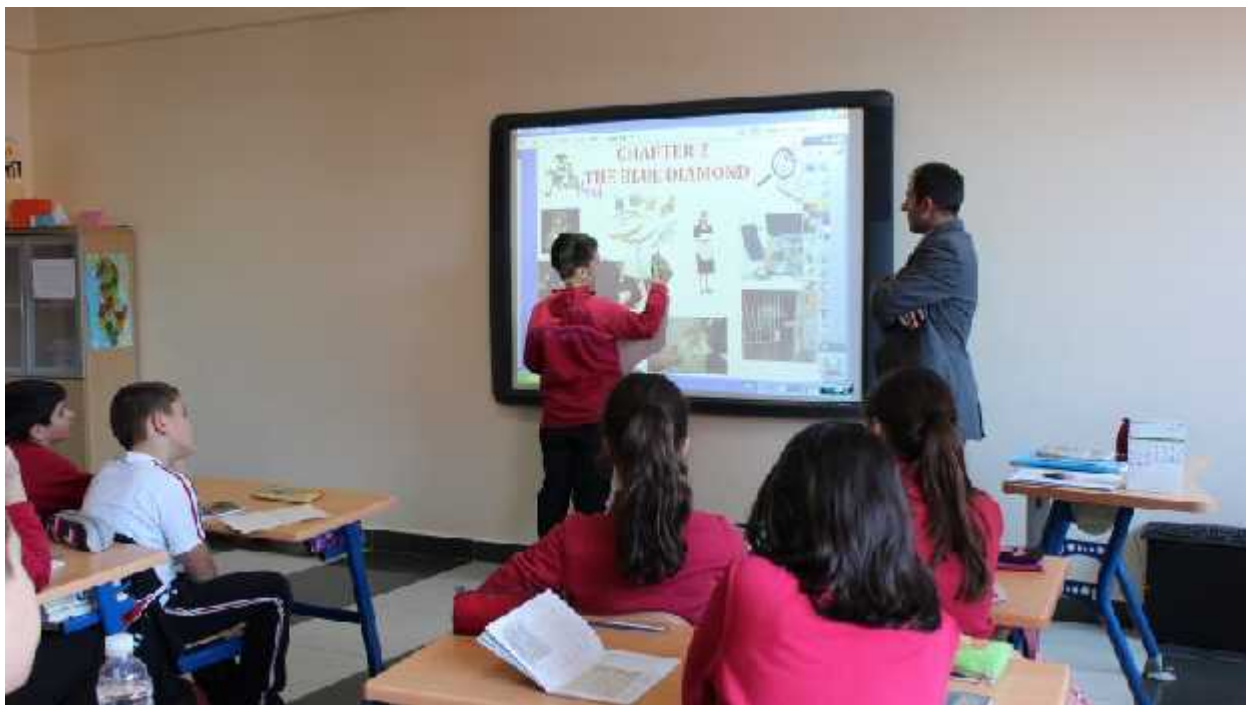
Fig nr.4 Klasa elektronike

Mësimi përmes kompjuterit i nënshtrohet kërkesave të teorisë së informacionit dhe të komunikimit, meqë bën të mundur informimin dhe komunikimin dhënës-marrës, përkatësisht kthyes. Nxënësi di qfarë informacionesh-njohurish merr nga program kompjuterik, në të njëjtën kohë duke komunikuar më programin kompjuterik din ë cilin nivel i ka përvetësuar ato njohuri. Pra, duke nxënë përmes kompjuterit, nxënësi zhvillon komunikimin dykahësh-mësimnxënien duke nxënë njohuri, por edhe duke njohur rezultatet e mësimnxënies së pavarur aktive. Kompjuteri, që përdoret për mësimnxënie individuale quhet kompjuter individual. Lidhja e kopjuterëve ndërmjet vete përmes kablove të koncentruara në terminalin komandues të arsimtarit, formon klasën elektronike për mësimnxënie të pavarur sipas programit të degëzuar ose linear për përparim individual.