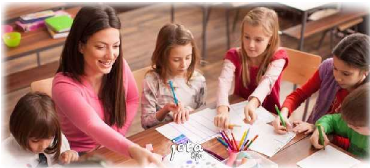
Fig.1 Zhvillimi i mësimin në shekullin. 21

7 Korniza e re e Kurrikulës së Kosovës është hartuar dhe ka filluar zhvillimi i përmbajtjeve të kurrikulës në fusha të caktuara mësimore. Korniza e Kurrikulës së Kosovës( K K K ) është e përcaktuar për prespektivën e bazuar në kompetenca, me qëllim që t’i adresojë nevojat e ndryshme të nxënësve për zotrimin e kompetencave kyqe, qka do t’u mundësojë atyre te përballen me sfidat e tashme dhe të ardhshme të shoqërisë kosovare dhe më gjerë. Programet për avansimin e mësimdhënësve në fushat e ndryshme mësimore kanë për objektiv zhvillimin e këtyre shkathtësive relevante tek nxësit duke zbatuar metodologji te bazuara në të nxënit përmes projekteve, zgjidhjes së problemeve, hulumtimit praktik etj. Në strukturën e K K K-së, në mes të tjerash, risi është edhe qasja e integruar në mësimin e shkencave të natyrës në shakllën e tretë dhe të katërt të kurrikulës që përfshin klasat prej 6 deri 9, përkatësisht nivelin e shkollës së mesme të ulët .